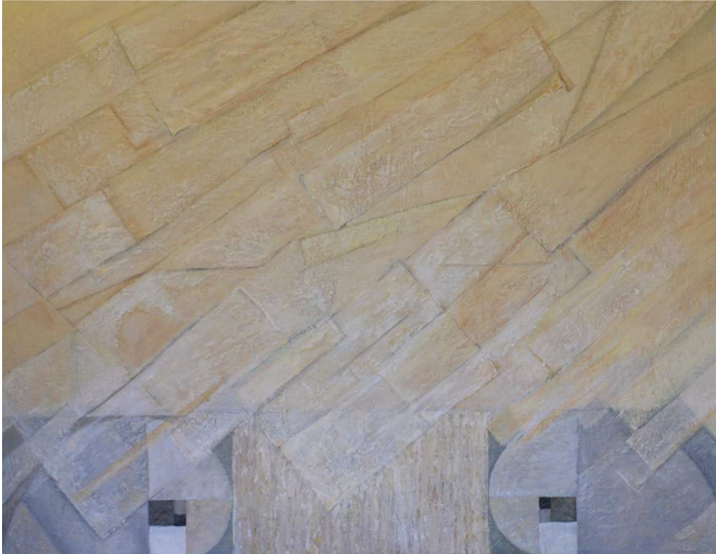
f. 6 Razón y totalidad. Mixta sobre lienzo. 100x130 cm