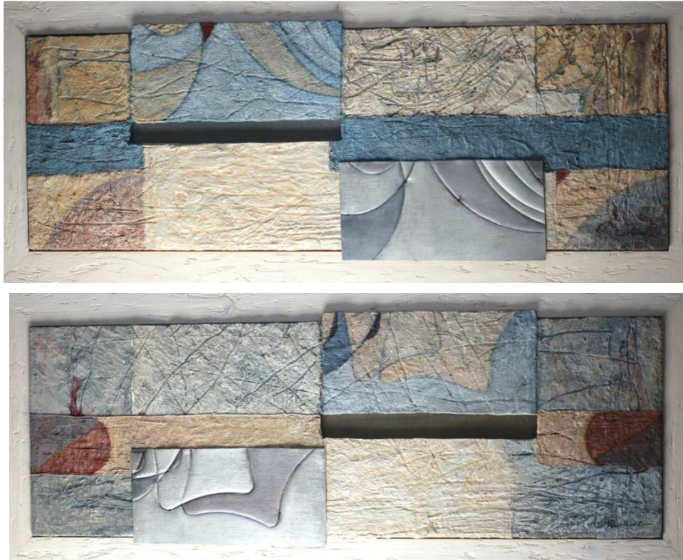
f. 3 indagaciones 3 y 4. Mixta con metal sobre madera. 30x75 cm