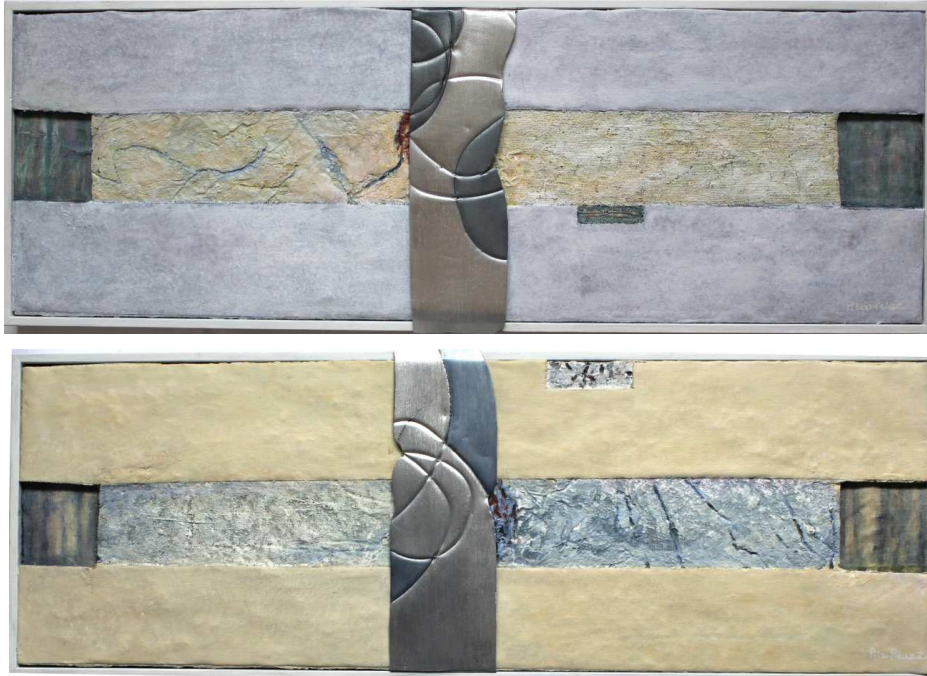
f. 2 Indagaciones 1 y 2. Mixta con metal sobre lienzo. 30x75 cm

Camino, unos duros, inhóspitos, otros esmaltados. Se cruzan metales, pulidos, grabados. Esa lejana materia se torna, después de un minucioso trabajo, en algo próximo, sentido.