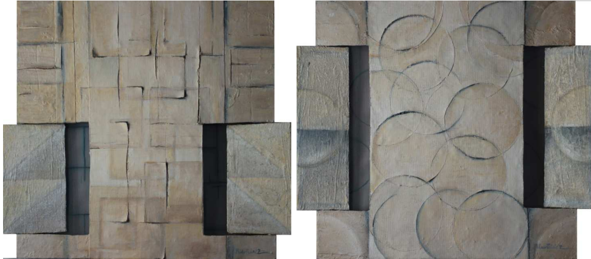
f. 5 Selfies geométricos 1 y 2. Mixta sobre lienzo. 40x40 cm

Esto que hay aquí: “selfis” con filtros geométricos, son una mirada a uno mismo, un querer verse como una estructura ordenada. Miradas hacia dentro, hacia ese imposible yo estructurado. Un viaje hacia uno mismo, hacia su autenticidad, tratando de romper el ego asfixiante, abriéndose hacia más allá de uno mismo, hacia el otro y hacia esa totalidad que es el mundo.