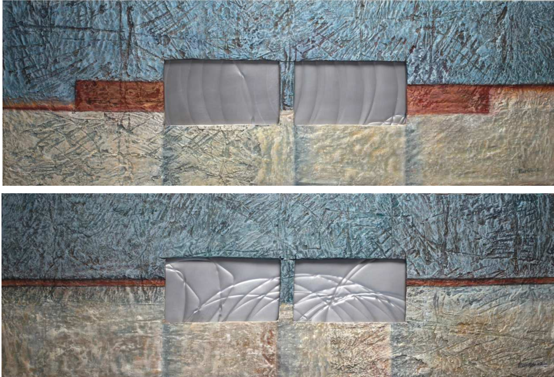
f. 4 Cuesta ver 1 y 2. Mixta con metal sobre madera. 30x75 cm